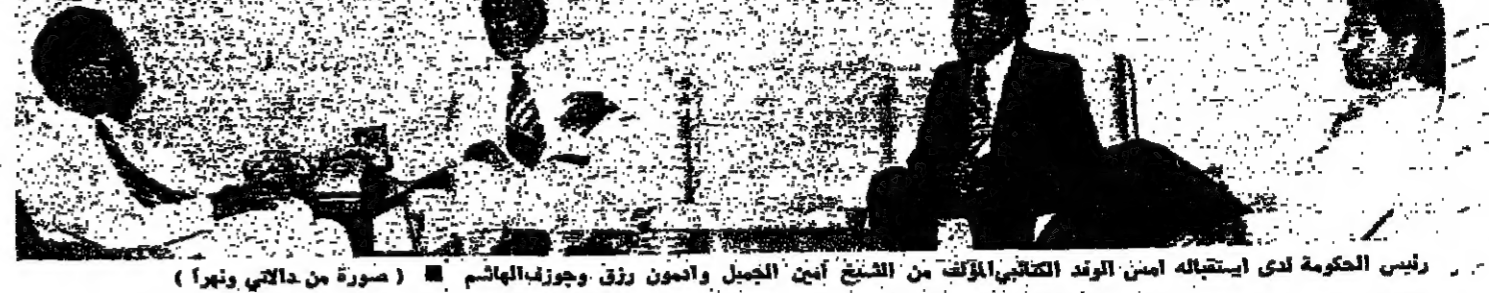
رئيس الحكومة لدى استقباله امين الوعد الكتابي المذيق من الشيخ امين الجليل وامون رزق وجوزاب الهاسم